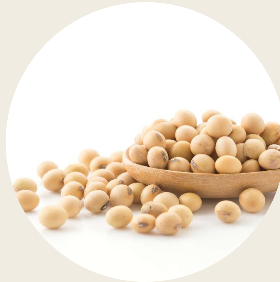
Proteína de Soja