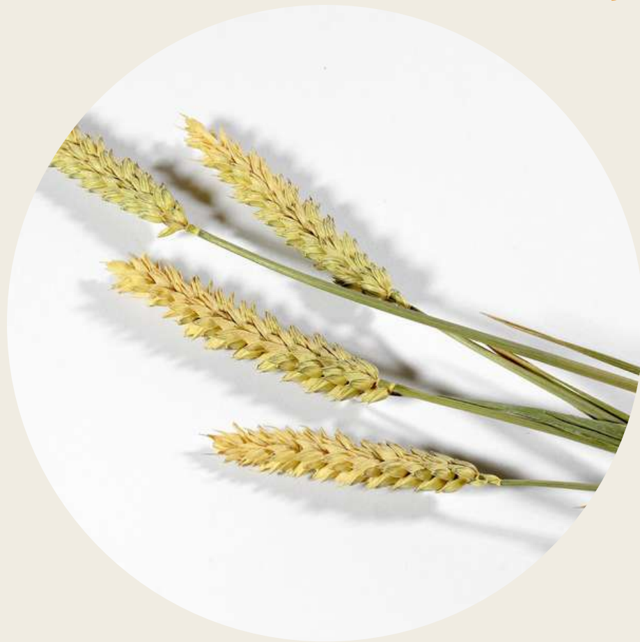
Proteína de Trigo